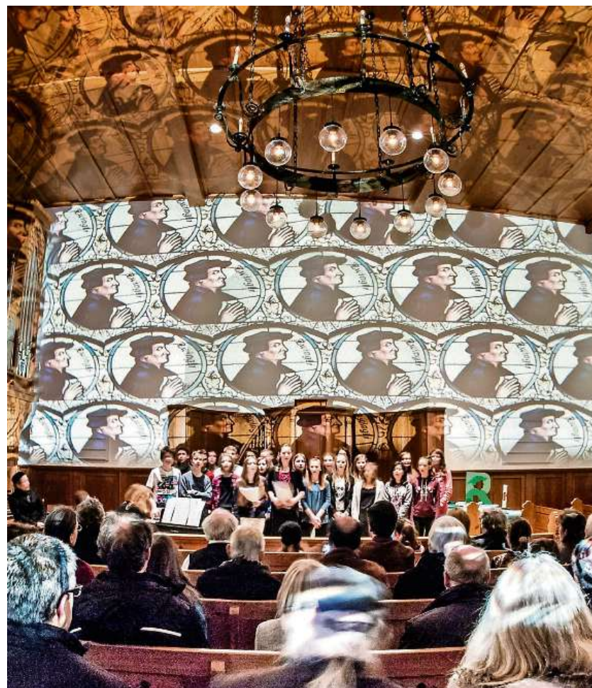
Verwandlung: Lieder, Lichtkunst und Gespräche rücken die Weesener Zwinglikirche in ein anderes Licht.